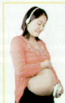
唔使打針唔使開肚唔使剪胎動索，勝在方便簡單，溫馨一點又有可能聽到BB其他聲音，雖然你肯定唔會聽得明，但都叫雀躍兼互動，胎教完之後可以聽吓有冇反應呀。

Fetal Doppler能夠隔着肚皮都可以經其筒聽到BB心跳，唔使打針唔使開肚唔使剪胎動索，勝在方便簡單，溫馨一點又有可能聽到BB其他聲音，雖然你肯定唔會聽得明，但都叫雀躍兼互動，胎教完之後可以聽吓有冇反應呀。