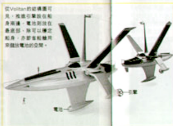
從Volitan的結構圖可見，推進引擎設在船身兩邊，電池則放在最底部，除可以穩定船身，亦節省船艙用來儲放電池的空間。