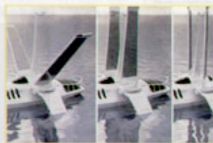
巨翼可作3層變化，由吸收太陽能到雙翼再拉轉成為風帆，有關標準的動人魅力。

其實Volitan在設計上亦複製了太陽能的一些缺點，例如太陽能只夠力推動2台220匹的引擎，所以Volitan的船身以超輕玻璃製成。至於我最關心的速度及電力備用時間，由於實物尚未製成，實際數字仍有待確認。