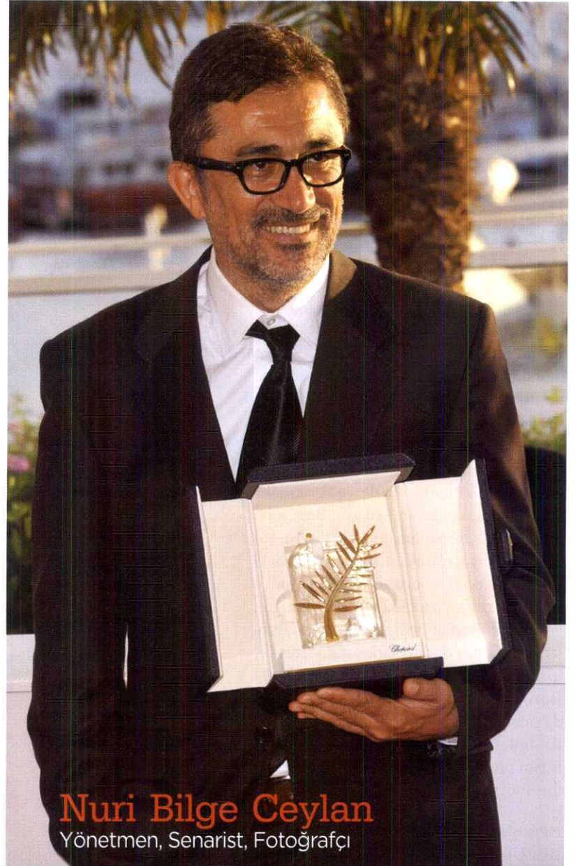
Nuri Bilge Ceylan Yönetmen, Senarist, Fotoğrafçı

MediaCat'in Mart sayısında 50 yaratıcı Türk'ü bu sayfalarda bir araya getirdik. Bu isimleri seçerken de salt yaratıcılıkla sınırlı kalmadık ve birkaç kriter belirledik. Alanında yaratıcı ve inovatif, bir ya da birden fazla çalışmaya imza atmış, bu çalışma ile ulusal/uluslararası ödüller kazanmış, yeni bir kategori/ tür/format geliştirmiş, bir girişim başlatmış ve bu girişimle sürdürülebilir bir başarı elde etmiş, önemli bir soruna etkili bir çözüm getirmiş ve yeni bir trend yaratmış kişileri araştırdık ve 2014 yılında bu kriterlerden en az ikisini gerçekleştirerek alanında fark yaratmış 50 ismi belirledik.